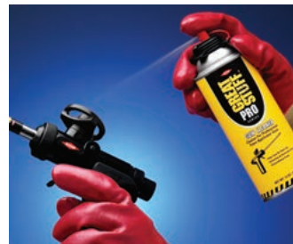
Elimine la espuma no curada de la pistola.