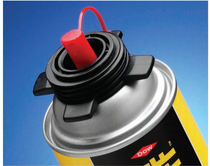
Limpiador con la boquilla de atomización roja colocada.

Frote la punta del tambor contra una madera suave para quitar toda la espuma. Nunca utilice un objeto filoso para limpiar la punta del tambor. Esto puede dañar la punta y el vástago interno, y generar filtraciones en la pistola.