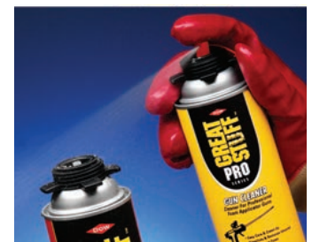
Elimine la espuma no curada del adaptador de la pistola o lata.