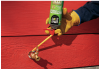
Traversées de robinet d'eau