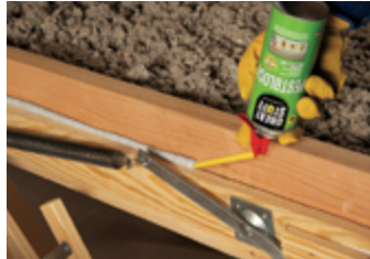
Cadre de trappe de grenier